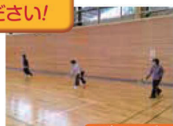
スポーツエンジョイ

↑軽スポーツ(ビーチボール・フレッシュテニスなど)を中心とした運動を行います。 楽しみながら運動不足を解消しましょう。