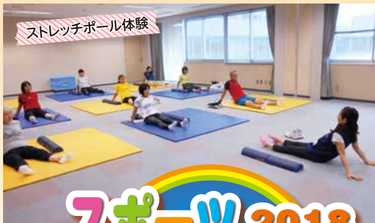
ストレッチポール体験