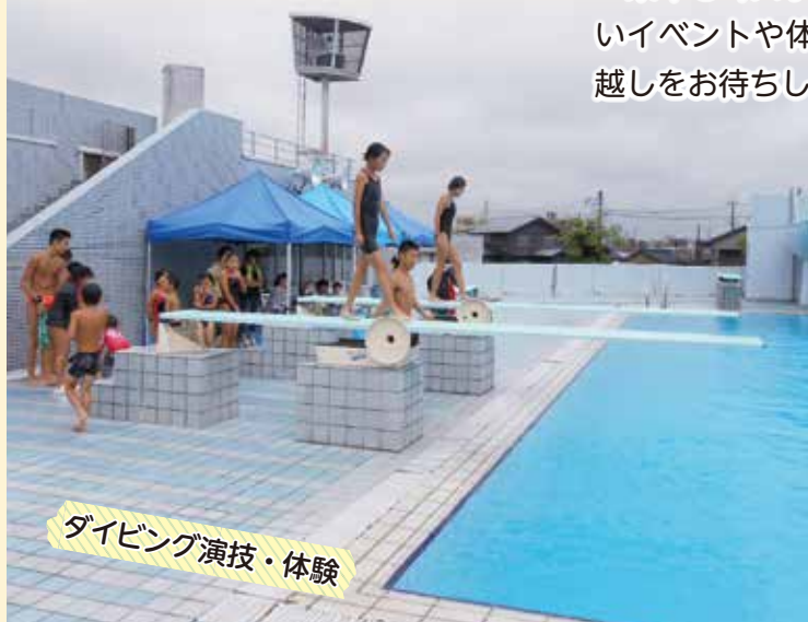
ダイビング演技・体験